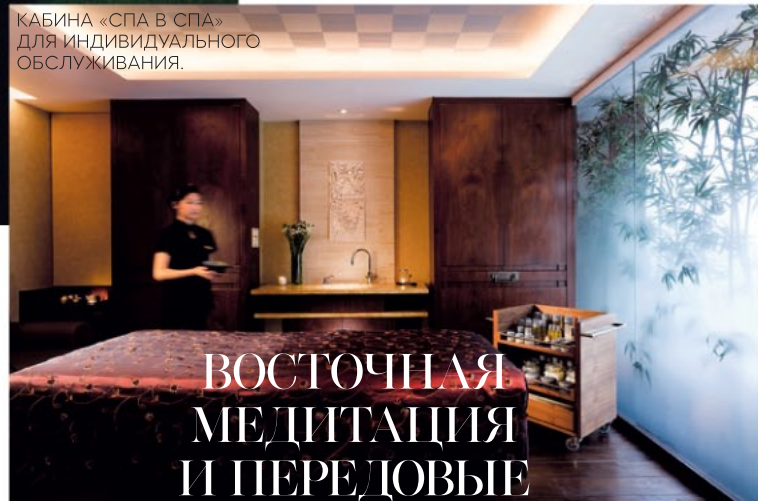
КАБИНА «СПА В СПА» ДЛЯ ИНДИВИДУАЛЬНОГО ОБСЛУЖИВАНИЯ.