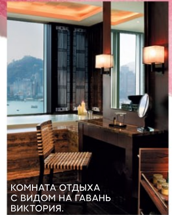
КОМНАТА ОТДЫХА С ВИДОМ НА ГАВАНЬ ВИКТОРИЯ.