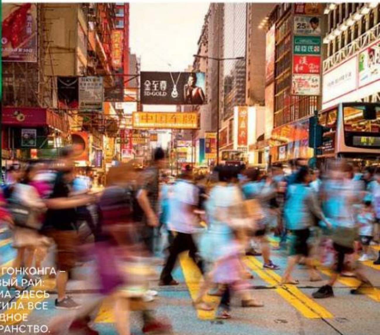
УЛИЦЫ ГОНКОНГА — ТОРГОВЫЙ РАЙ: РЕКЛАМА ЗДЕСЬ ЗАХВАТИЛА ВСЕ СВОБОДНОЕ ПРОСТРАНСТВО.

На пути к пляжам юго-востока Азии сделайте остановку в Гонконге: Запад здесь соседствует с Востоком, бутики — с отличными ресторанами, а живая старина — с будущим.